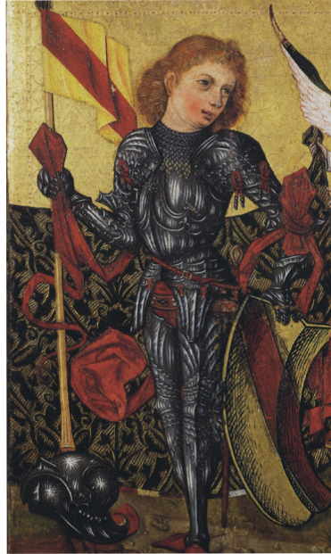
O BEATUS BERNARDUS MEMENTO MEI

Amen, Amen, Amen. Ehre sei dem Namen unseres Herren Jesu Christ, der der Erst und Letzte ist.